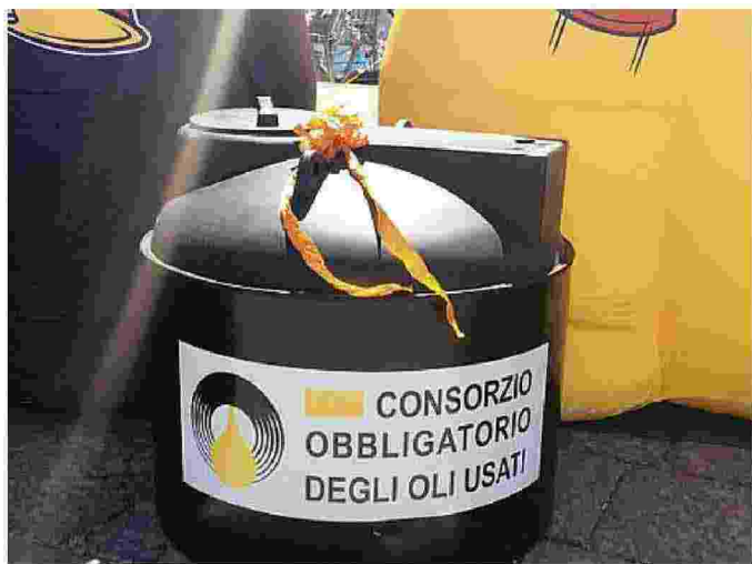
Campagna educativa tra i ragazzi per la raccolta degli oli usati

degna e in particolare in Provincia di Sassari. Il Consorzio proporrà, insieme ai relatori, le soluzioni ad eventuali difficoltà o inadempienze. L'olio lubrificante usato è un rifiuto pericoloso che deve essere smaltito correttamente. Se utilizzato in modo improprio può essere estremamente dannoso per l'ambiente e per la salute umana: basti pensare che 4 kg circa di olio – il cambio di un'auto – se versati in mare posso coprire una superficie grande quanto un campo di calcio.