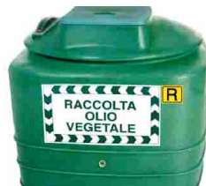
A Ladispoli arrivati i contenitori per gli oli vegetali - Terzo Binario News