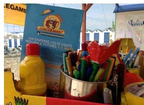
Educazione ambientale sulle spiagge, arriva a Ladispoli "CircOLLiamo Estate" - Terzo B...