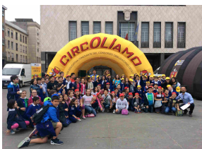
Arriva a Civitavecchia CircOLLiamo , la campagna educativa itinerante del Consorzio Oli Usati